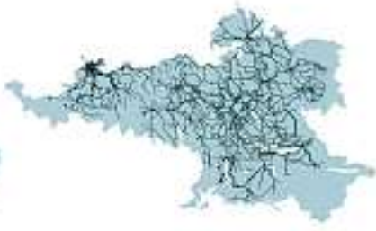
S-Bahn-Netz Grossraum Zürich