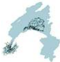
Réseau RER lémanique

In generale un alto tasso di mezzi di trasporto non motorizzati e pubblici viene valutato come indice di qualità della vita. La messa in esercizio della S-Bahn di Zurigo ha promosso il collegamento regionale: in 5 anni il traffico passeggeri ha registrato un incremento del 31 %. Nella densamente popolata Svizzera è importante disporre di un'efficiente infrastruttura dei trasporti pubblici, non da ultimo per promuovere lo sviluppo territoriale sostenibile. A paragone con il contesto nazionale la regione Ginevra-Losanna presenta palesi deficit, che rendono necessaria la chiusura di lacune nella rete e l'associazione delle imprese di trasporti urbani. In questo modo si dovrebbe poter influire positivamente sullo sviluppo territoriale, sullo scambio regionale ma anche sull'attrattività e la competitività economiche.